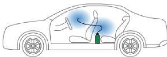
Etak®JET 前方噴射、後方缶設置の場合※

※効果は噴射液がついた部分に限られます。 ※使用環境により異なる場合があります。