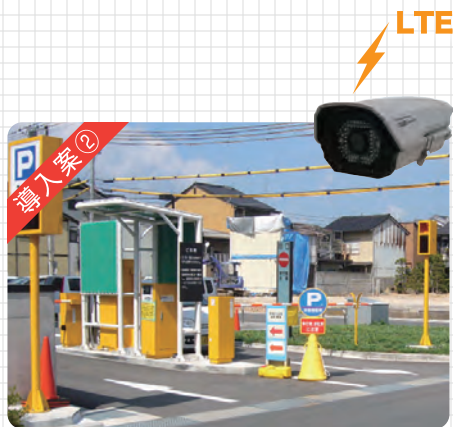
駐車場の不正利用者映像