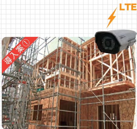
〇〇様邸 新築工事の作業映像