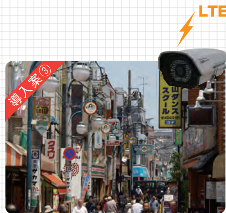
商店街の防犯映像