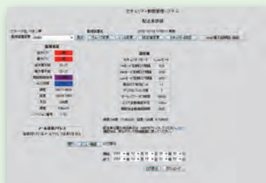
電子錠遠隔監視・制御画面