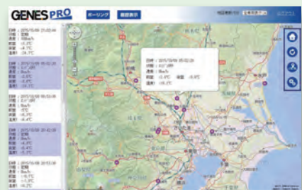
クラウド地図 ※オプション対応